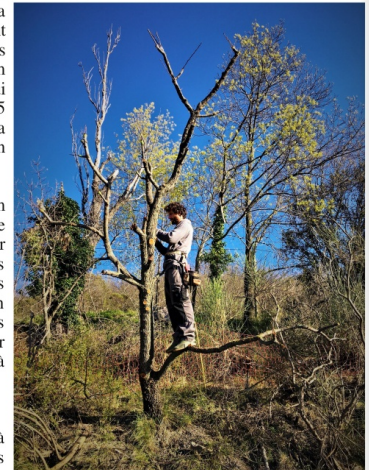
47 greffons sur 33 branches ! Pour une demie-journée de travail !

Une variante de la première méthode consiste à couper sévèrement l'arbre tout en conservant les premières branches principales à la hauteur souhaitée. Ensuite, on laisse passer une saison de pousse, et l'arbre réagit en produisant de